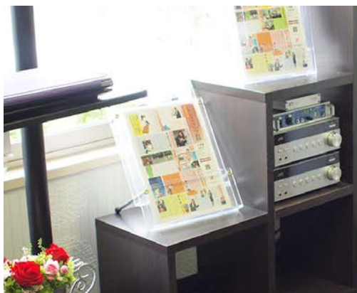
森・川およびアンビエント楽曲によるおもてなしの気持ちで設えられた応接室

働き方の多様化や、雇用にも様々な制約がある中で企業経営も簡単ではありませんが、こういったソリューション技術もお借りしながら会社のチームワークを強化して、社会に貢献できる企業活動をもっともっと展開していきたいですね。