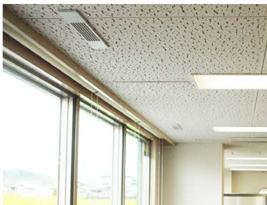
ハイレゾリソース音源と間接音響環境による気持ちの良いオフィス環境