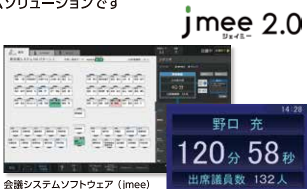
会議システムソフトウェア (jmee)