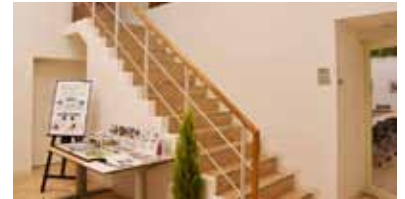
エントランスとなるピロティにもKooNeを導入