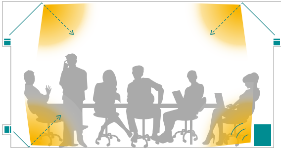
独自の空間音響設計で、自然にやわらかく包み込まれるような音空間を再現。

より自然に「音」が届く間接音環境を構築することで、聴覚を中心とした「居心地の良い空間」を創造する空間音響デザインソリューション。森・川・波の категорияで現地収録した自然音源やアンビエントサウンドを提供いたします。