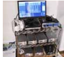
シンプルな送系機器ラック