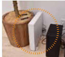
スーパーウーハー