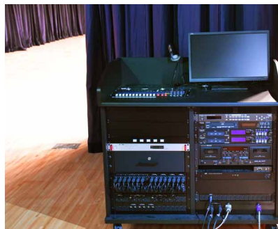
ステージ袖のサブコンソール