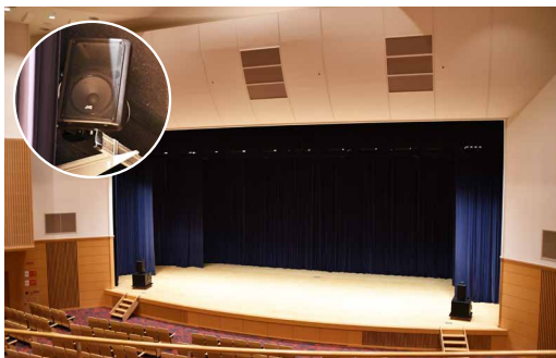
3階構造で約700席を有するホール内適所に各スピーカーを配置