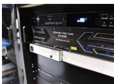
バックヤードではシステム制御やプロジェクター操作はもちろんHD PTZカメラからのライブ配信/映像制作システムまでを運用