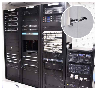
放送室ではアナウンスの他、会場の音声収録も可能