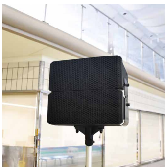
移動可能なアレイスピーカーは指向制御と遠距離伝達に優れたPS-S318