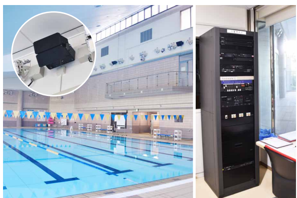
サブプール壁面のアレイスピーカー。制御機器はラックに収納