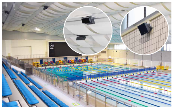
10コースが並ぶメインプールの天井と壁面にスピーカーを配置