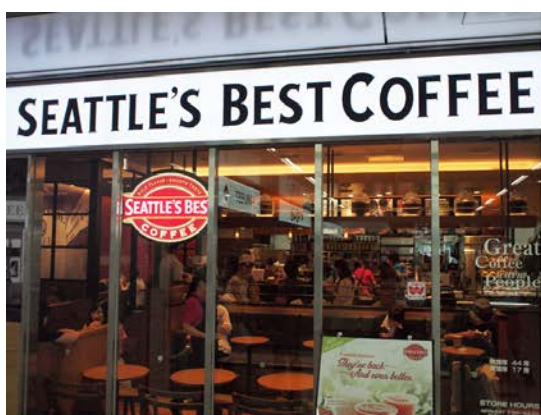
居心地の良さを追求した シアトルズベストコーヒーJR博多店

「KooNe」には、費用対効果だけでは計れないクオリティがあると思います。この店舗が九州でのモデルとなって、そこを他の方にも是非体感していただけると嬉しいです。そうして「KooNe」の販売も更に伸びて、ランニングコストがもう少し下がれば更に嬉しいです。